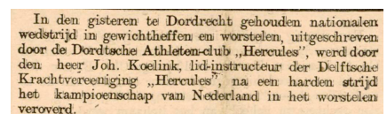
Delftsche Courant, 28 juni 1902.