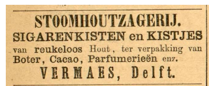
Jan's werkgever adverteert in de Leeuwarder Courant van 2 april 1900.