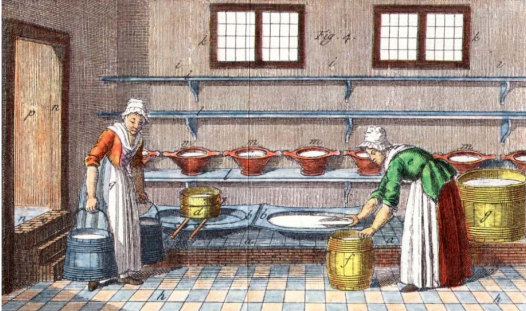
Een melkkelder omstreeks 1800. Op de hoge plank staan trechtvormige aardewerken melktesten om de (afgekoelde) melk in te laten romen, nadat ze door een 'teems' (zeef) gegoten was. Daarvoor gebruikte men ook wel 'melkmouwen', platte houten schalen die de verdieping eronder staan. De room werd uiteindelijk met een schep 'afgeroomd' en in de 'roomsta' of 'roomstaar' (f) gedaan, een gladde ton, tot er genoeg was om te gaan karnen. Tekening uit Francq van Berkhey, 1811.

Het huis aan de Nieuwe Langendijk had een kelder waarin zestien melktesten stonden (om de melk in te laten romen) en een botervloot.